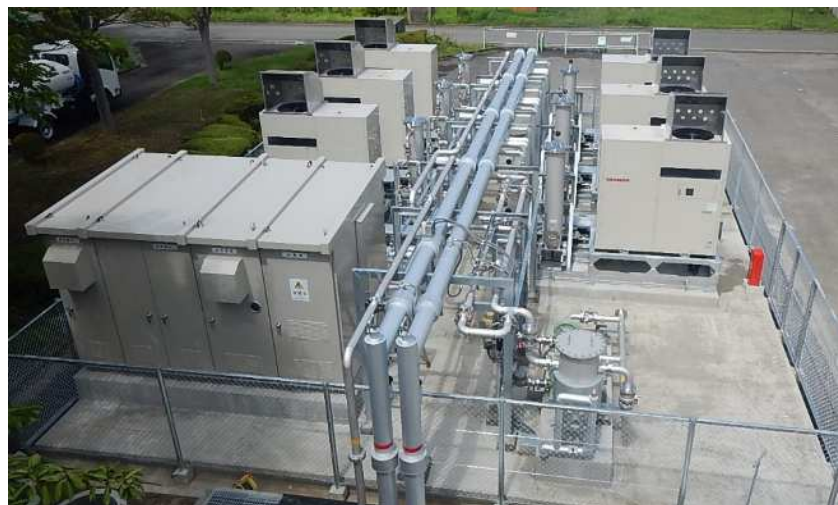
消化ガス発電設備